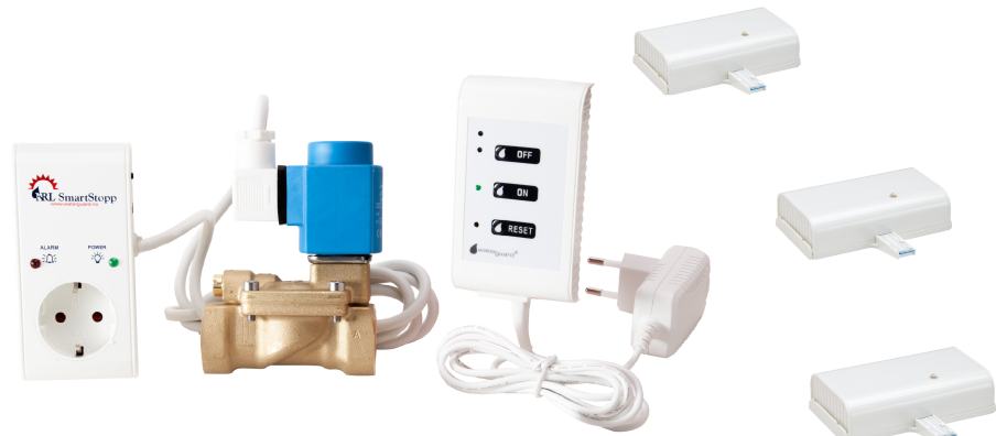
Smart Hus /SD Anlegg Rele utganger